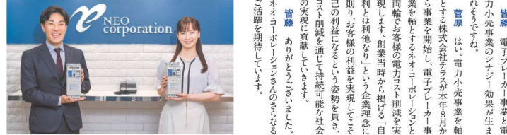
Neo Corporation staff members.